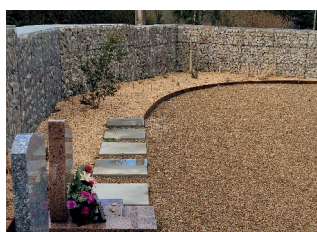
Jardin du souvenir