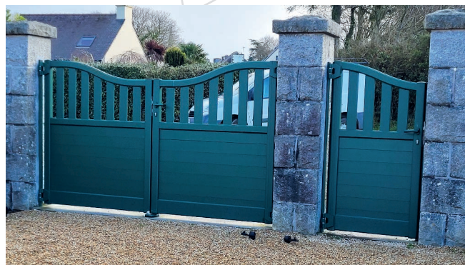
Nouveau portail du cimetière