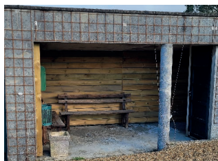
Divers aménagements du cimetière

Ce lieu de mémoire et de recueillement est ouvert aux familles mais également aux visiteurs désirant découvrir un patrimoine local méconnu.