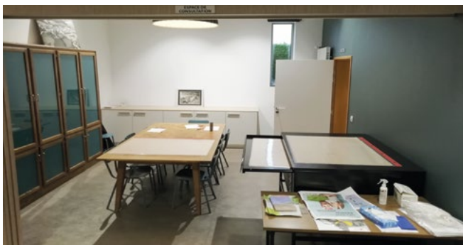
Salle de consultation.

Une chaudière à granulés pour le chauffage, couplée à des panneaux solaires, procure une production d'eau chaude. Une VMC double flux à très haut rendement améliore la qualité de l'air. Cela nous permet d'obtenir un meilleur retour sur investissement tout en limitant l'impact sur l'environnement. L'éclairage à Leds couplé à des détecteurs contribue à réaliser des économies d'énergie.