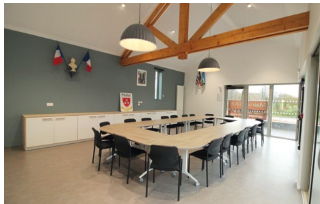
Salle du conseil municipal.

Sur les conseils de Roland, technicien municipal, nous avons déplacé notre ancien panneau routier datant de 1958. Implanté dans les espaces verts, il apporte un cachet supplémentaire et embellit l'ensemble.