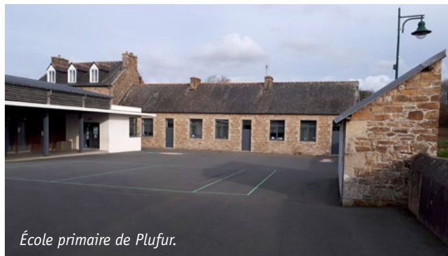
École primaire de Plufur.

S'il y a un mot pour définir le Regroupement Pédagogique Intercommunal c'est bien « persévérance ».